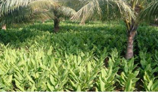
தென்னை + மஞ்சள்