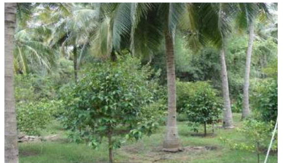
தென்னை + மங்குஸ்தான்