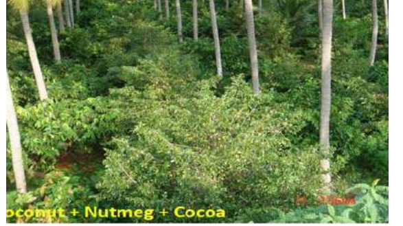
தென்னை + ஜாதிக்காய் + கோகோ