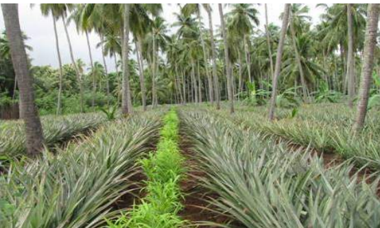
தென்னை + அன்னாசிப் பழம்