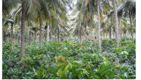
தென்னை + கோகோ