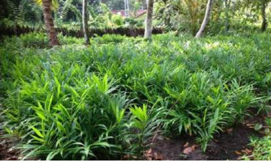
தென்னை + இஞ்சி