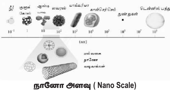
நானோ அளவு (Nano Scale)

மேலும் மருத்துவத்துறையிலும் கண்ணிதுறையிலும் இதன் பயன்பாடு மெச்சத்தக்கவகையில் உள்ளது. சமீப காலமாக உணவுத் துறையிலும் இதன் பயன்பாடு அதிகரித்து வருகின்றது என்பது குறிப்பிடத்தக்கது.